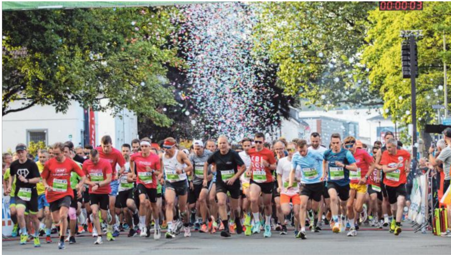
Großes Gedränge am Start: Die schnellsten Läufer positionieren ganz vorne und mit dem Startschuss geht es auf die rund 5500 Meter lange Strecke.

Der Firmenlauf ist immer ein buntes Treiben. Neben sportlich ambitionierten Männern und Frauen stehen auch Teams, denen es einfach nur um den Spaß geht.