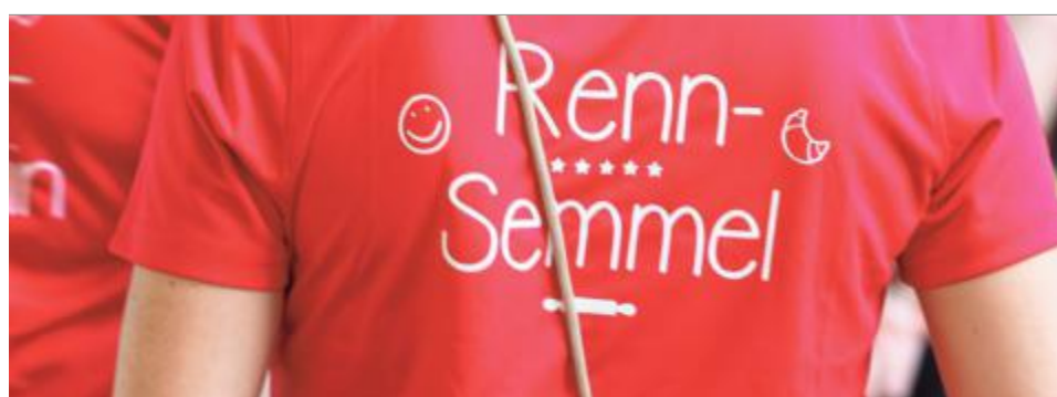
Auch das gehört zum Firmenlauf: Teamnamen mit Anspielungen auf den eigenen Beruf.