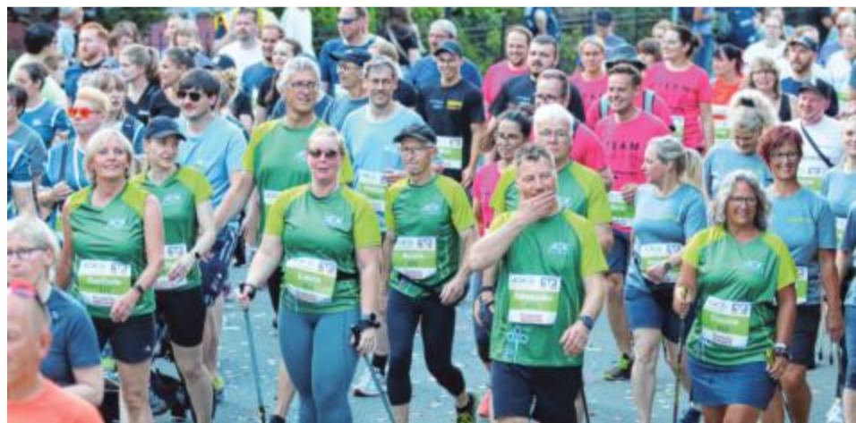
Der Firmenlauf gehört den Mannschaften, „Einzelläufer“ sind nicht am Start.