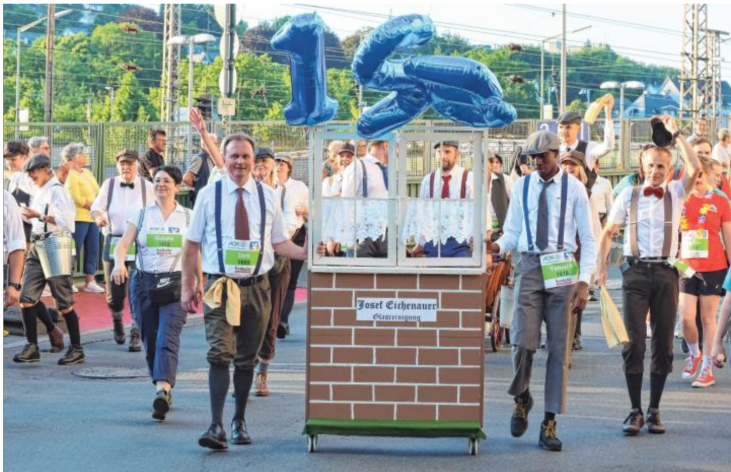
Fantasievolle Kostüme gehören beim Siegerländer Firmenlauf mit dazu.

Viele andere Teams glänzten mit fantasievollen Namen und Anspielungen auf den eigenen Beruf. Dazu spielt „Dopamine Dressing“ in einer Vielzahl von strahlenden Neon- und Pastellfarben auch bei den Sportartikelanbietern eine immer größere Rolle – die bunte Funktionskleidung der flinkeren Läufer ergänzte somit die ohnehin schon sehr farbenprächtigen Lauf-T-Shirts der einzelnen Firmen. Wie Martin Hoffmann richtig feststellte, ist der Fir-