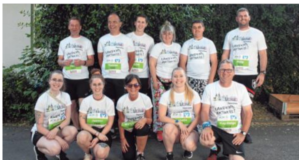
Auch die Siegener Zeitung hat in diesem Jahr wieder mit einem eigenen Team an der Laufveranstaltung teilgenommen.