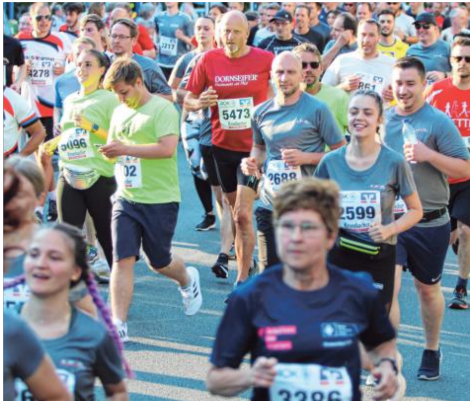
Insgesamt 5500 Meter lang ist die Strecke, die die 8500 Startenden übermorgen Abend bewältigen wollen.

dern werden die drei schnellsten gewertet. ▶ Startberechtigt: Startberechtigt sind Teams, deren Mitglieder jeweils einer Firma, einem Institution oder einer Behörde angehören. Möglich sind auch Laufteams, Selbsthilfegruppen und Angehörige von Berufsgruppen, die sich zu einem Team zusammenschließen. ▶ In Präsenz und virtuell: Zwei Events in einem – den Siegerländer Firmenlauf gibt es in Präsenz und virtuell. ▶ Helfer im Einsatz: Etwa 250 Helfer werden während des Firmenlaufs im Einsatz sein. ▶ Gute Stimmung: Zehn Musikstationen und Live-Bands sorgen entlang der Strecke für motivierende Stimmung. ▶ Kostenlose Fotos: Die Teilnehmerinnen und Teilnehmer erhalten kostenlose Fotos zum Runterladen – sie werden während der Veranstaltung angefertigt von professionellen Fotografen.