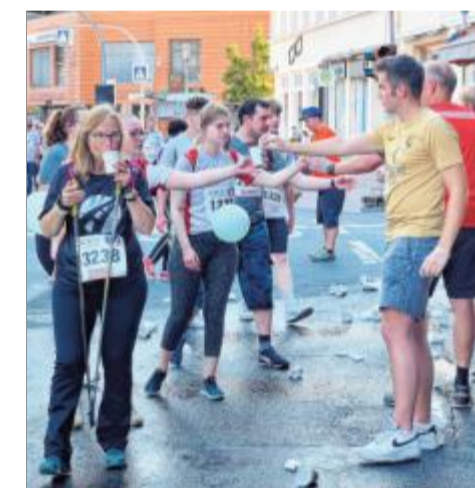
Kurze Pause: Auch übermorgen wird es wichtig sein, viel zu trinken.

Doch das ist Zukunftsmusik. Nun wird erst einmal in Weidenau gefeiert, zum 20. Mal übrigens. Der Siegerehrung um 21 Uhr schließt sich die gemeinsame Party an. Die Läuferinnen und Läufer – aber auch Zuschauer, Helfer und Organisatoren – werden sie sich dann wieder mal verdient haben.