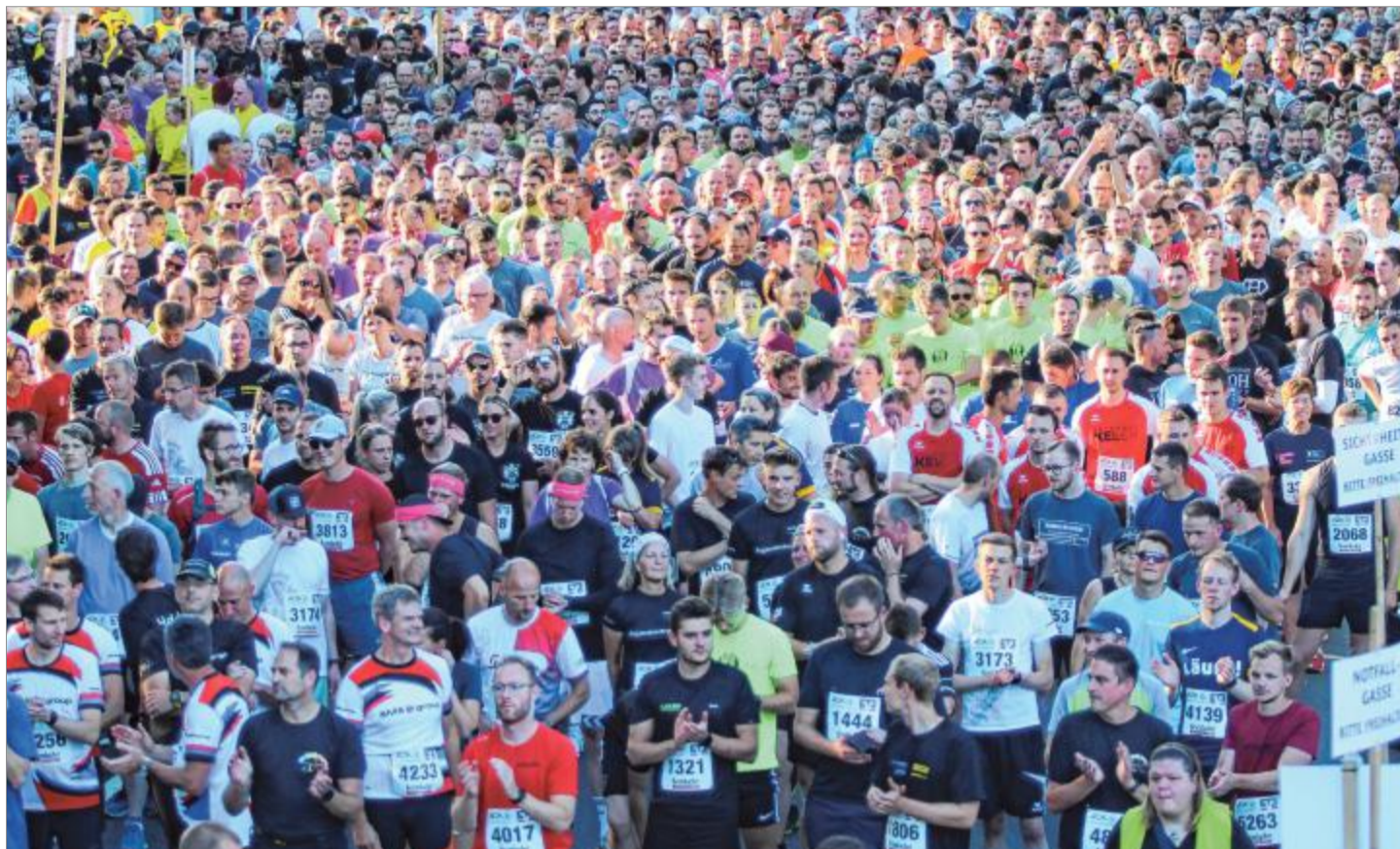
Am Mittwochabend wird es wieder voll auf dem Bismarckplatz in Weidenau: Ab 19 Uhr stellen sich die Läuferinnen und Läufer entsprechend ihres individuellen Leistungsvermögens auf.

Knapp 8500 Teilnehmerinnen und Teilnehmer werden auch in diesem Jahr wieder vor Ort mit dabei sein. Der gemeinsa-