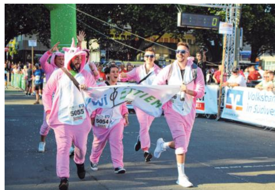
Zur Veranstaltung gehören auch die vielen bunten Kostüme, mit denen die Teilnehmer die Blicke der Zuschauer auf sich ziehen.