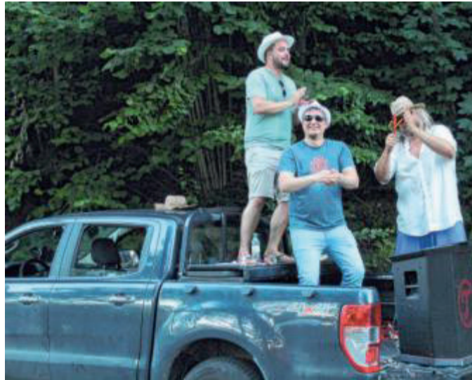
Die Stimmung rund um den Firmenlauf ist einzigartig.

Helfer werden während des Firmenlaufs im Einsatz sein. ► Gute Stimmung: Zehn Musikstationen und Live-Bands sorgen entlang der Strecke für motivierende Stimmung. ► Kostenlose Fotos: Die Teilnehmerinnen und Teilnehmer erhalten kostenlose Fotos zum Runterladen – sie werden während der Veranstaltung angefertigt von professionellen Fotografen. ► Auszeichnung: Die originellsten und schnellsten Teams erhalten wieder Pokale und Medaillen. ► Keine Langeweile: Geboten werden ein Bühnenprogramm mit Moderation und eine After-Run-Party auf dem Bismarckplatz. ► Farbenprächtig: Um 22.30 Uhr gibt es ein sehenswertes Abschlussfeuerwerk über Weidenau. ► Höhenmeter: 35 Höhenmeter sind auf der Strecke zu bewältigen. Gleich zu Beginn am Tiergarten und auf halber Strecke am Hufeisen am Bahnhof geht es bergauf. Aber keine Angst, die Läufer dürfen alles auch wieder hinunter laufen.