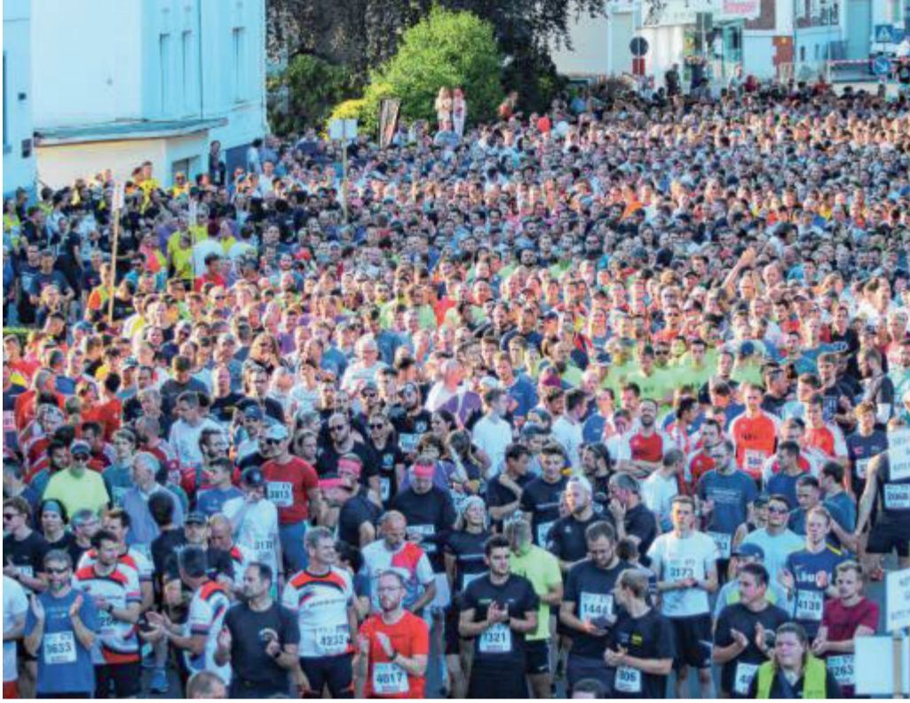
Rund 8500 Läuferinnen und Läufer wollen auch in diesem Jahr wieder an den Start gehen. Der Firmenlauf ist die größte Breitensportveranstaltung in der Region.

Wochen und Monate vor der eigentlichen Laufveranstaltung werde in den teilnehmenden Unternehmen bereits über das Laufevent gesprochen, würden T-Shirts angefertigt, werde in vielen Betrieben gemeinsam trainiert. „Der Firmenlauf ist eine Art Betriebsfeier für Menschen, die sich am Tag X treffen und zusammen Spaß haben. Dabei ist das Laufen für viele eher sekundär, ihnen geht es um das Erlebnis, um das Ereignis.“ Keine Frage: Die Veranstaltung sucht in einem Umkreis von 100 Kilometern ihresgleichen. Knapp 8500 Teilnehmerinnen und Teilnehmer werden auch in diesem Jahr wieder vor